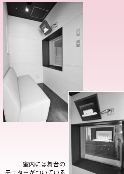
室内には舞台のモニターがついている

ホール2階には、親子で利用できる「親子室」を設けています。小さなお子さんをお連れの際にご利用ください。