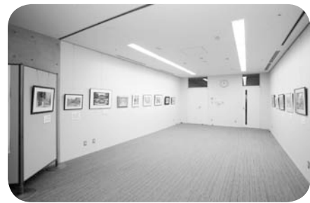
第3小会議室も利用した展示

作品の展示などに使えるスペースです。天井にワイヤーフックも完備され、絵画や写真などの作品発表の場としてご利用ください。隣接する第3小会議室と一体的に利用することも可能です。