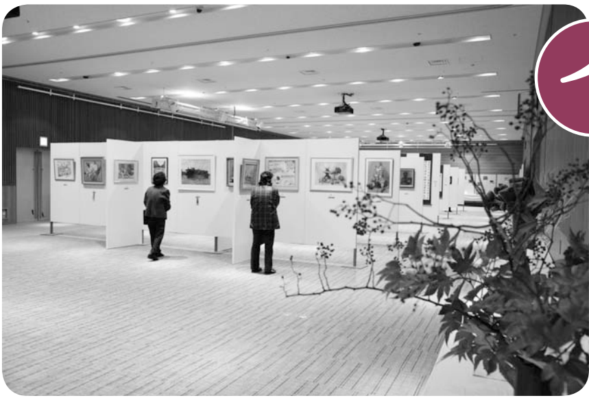
品川区民芸術祭2013の「区民作品展」の会場として使われたイベントホール